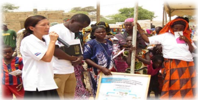
セネガルでの健康教育活動

助産師とは英語でMidwife = with womanといい「女性とともに在る」という意味です。今でも妊娠や出産が原因で亡くなる女性があります。女性や家族が安心して新しい命を迎えられるために、高い能力を備えた助産師の活躍は世界中で期待されています。日本で資格をとってから、海外で活動する助産師も多くいます。WHO（世界保健機構）やJICA（独立行政法人国際協力機構）といった国際機関ではたらく助産師もいます。世界中で活躍できる知識・技術・人間性など助産師としての基本は、助産師教育機関で学びます。