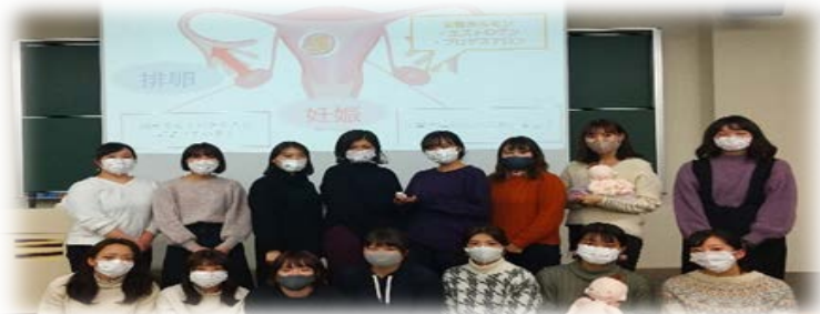
高校生に向けた健康教育