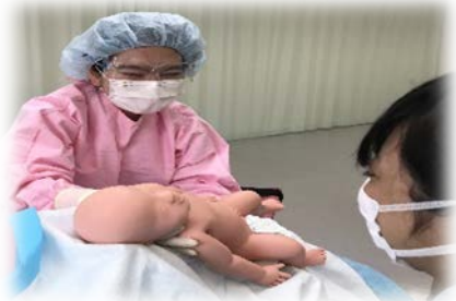
分娩介助技術演習

全国の助産師教育機関である正会員校一覧は、全国助産師教育協議会のホームページで見ることができます。