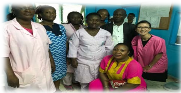
コートジボワール共和国医療施設での助産師活動