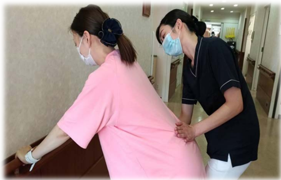
産婦さんに寄り添う助産ケア