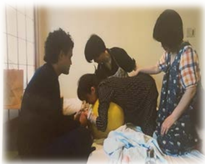
家族に見守られた出産

私たちは自律して妊娠中の女性や妊産婦の診察をし、出産の介助をします。また、病院で働くことも、自分で「助産所」を開設（開業）することもできます。現在、全国に約3万人の助産師がいます。