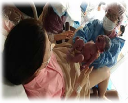
コロナ禍での出産