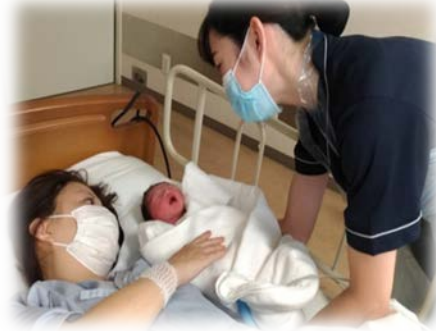
いのちが誕生する喜び